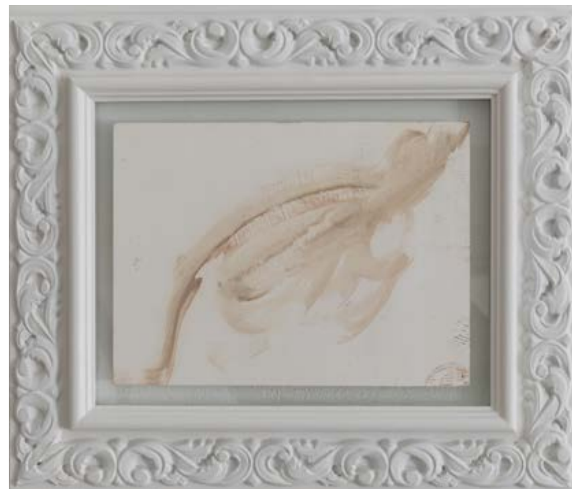
INNA NAPSO | astenersi IV, 2019, olio su carta, cm 28x21