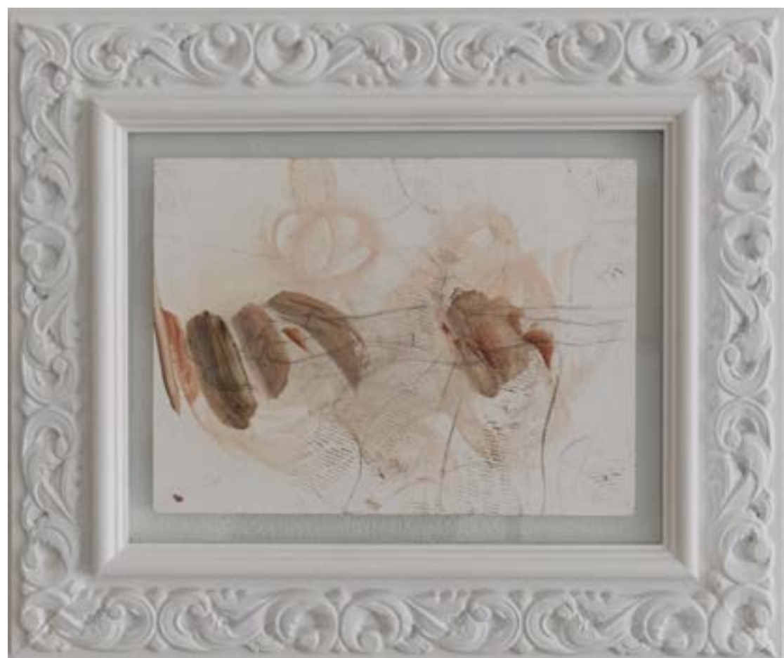
INNA NAPSO | astenersi III, 2019, olio su carta, cm 28x21