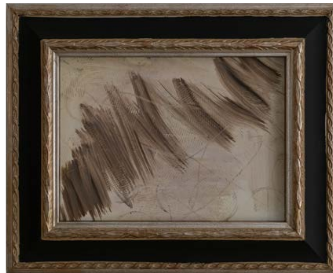
PERYLIPOS | dolore, 2019, olio su carta, cm 27x19.5