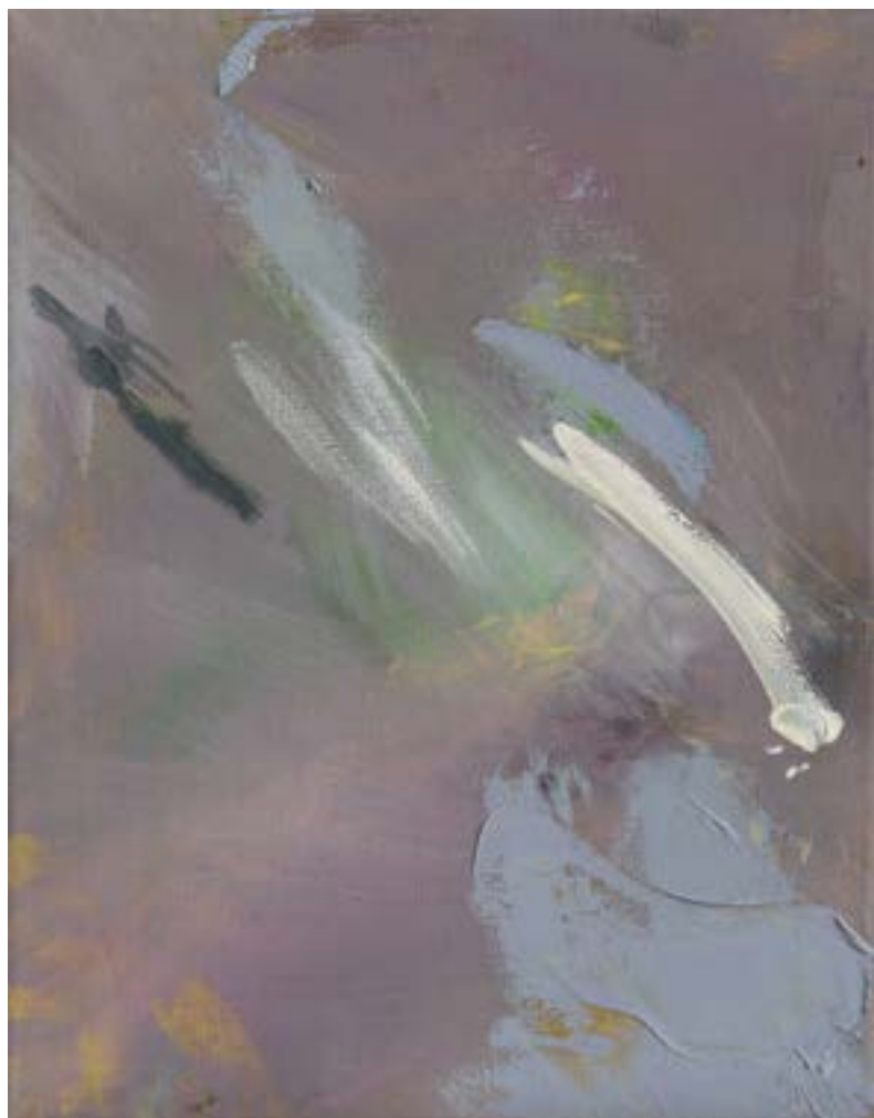
PLEDGE | le promesse solenni, 2020, olio su tela, cm 23x29