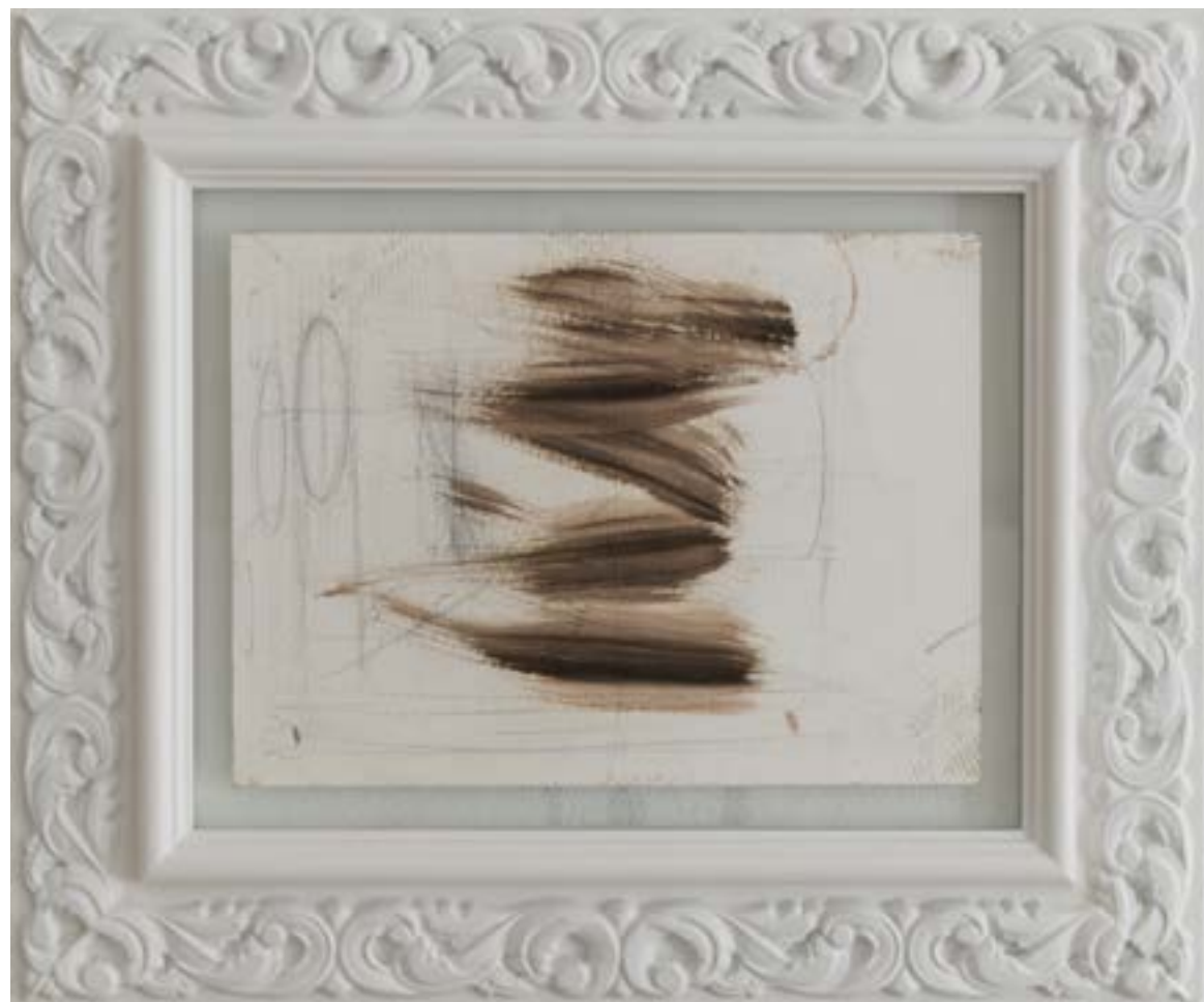
INNA NAPSO | astenersi I, 2019, olio su carta, cm 28x20.5