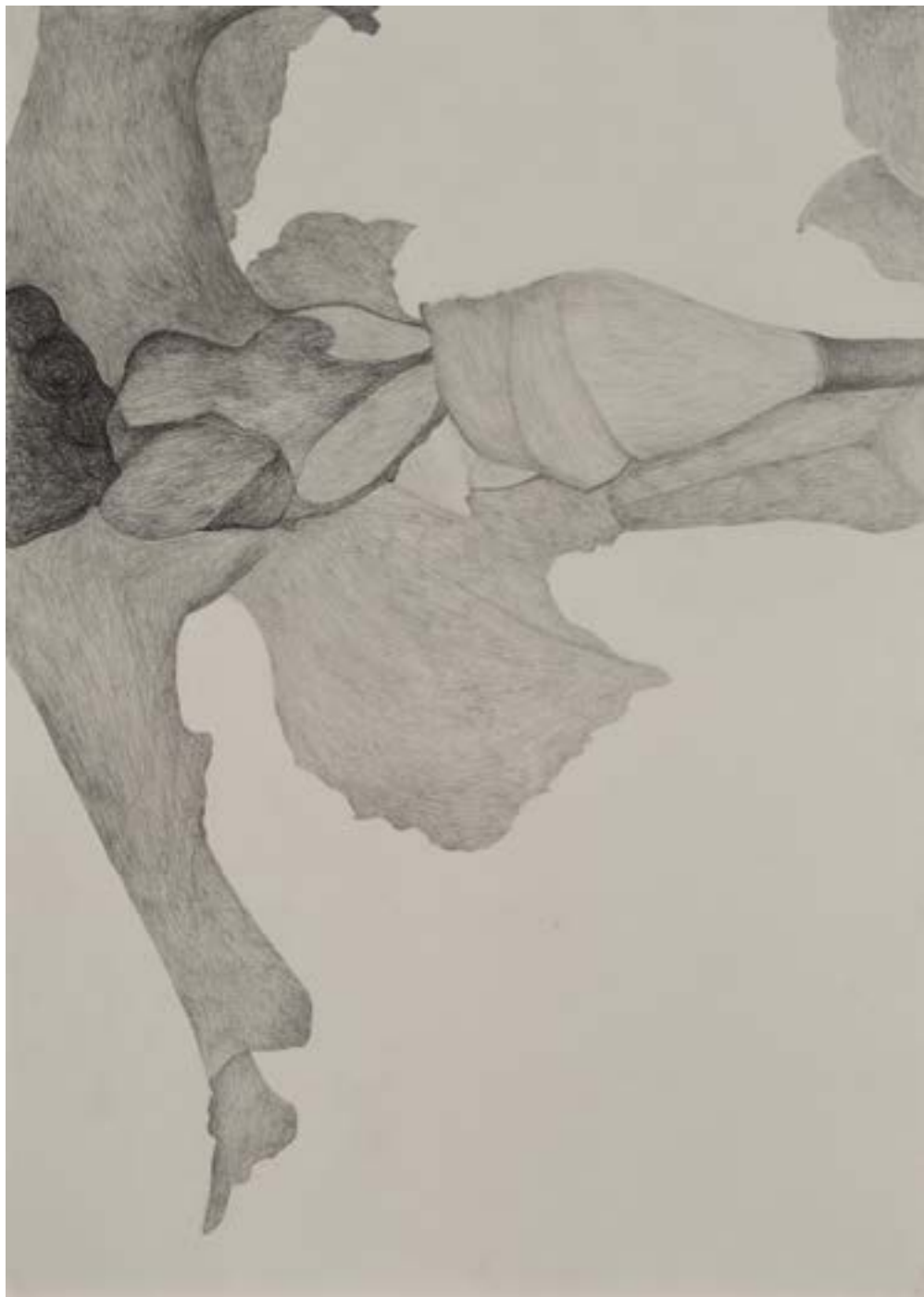
EGKRATEA | frutto della Temperanza 1/12, 2020, matita su carta grigia, cm 70x50