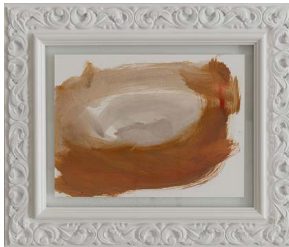
INNA NAPSO | astenersi II, 2019, olio su carta, cm 32x24