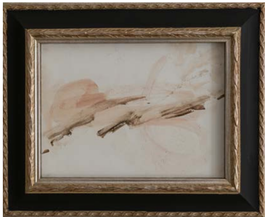
HEPSATO | Qualcuno mi ha toccato, 2019, olio su carta, cm 27x19.5