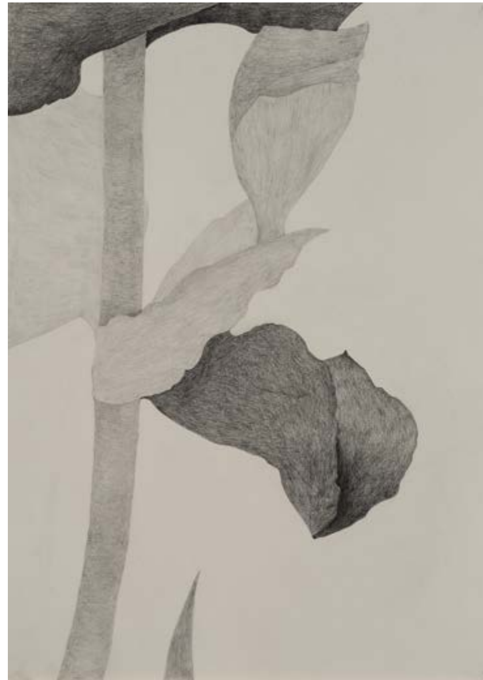
EGKRATEA | frutto della Temperanza 2/12, 2020, matita su carta grigia, cm 70x50