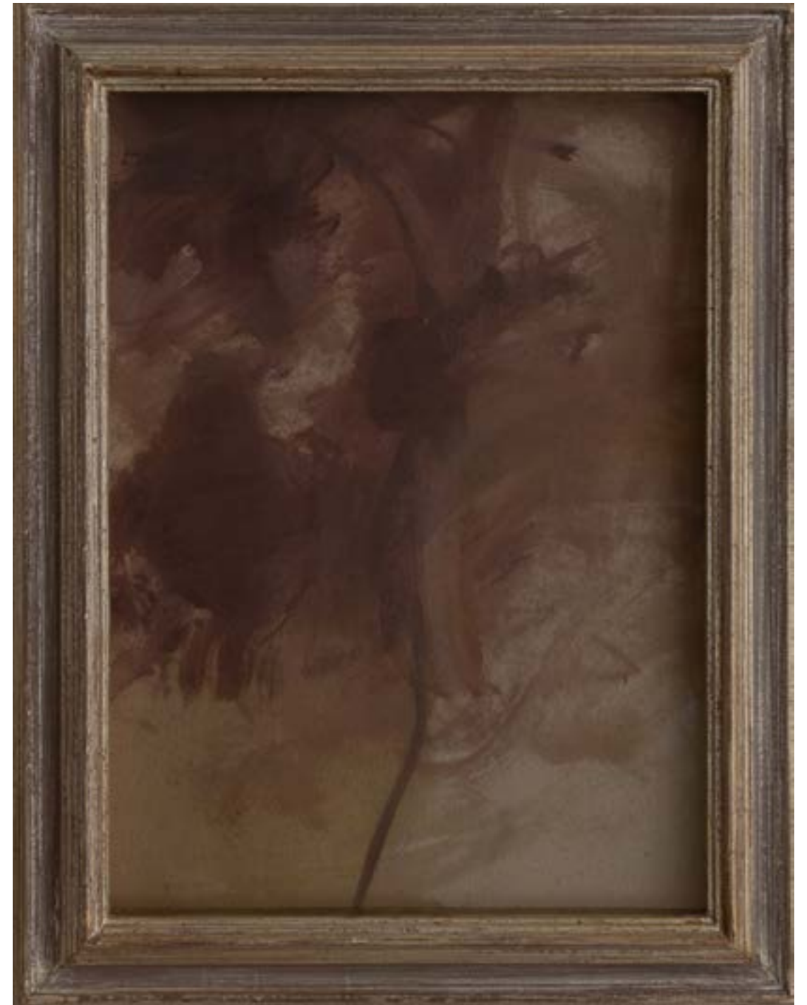
DELIGHT, 2019, olio su carta, cm 26.5x36.5