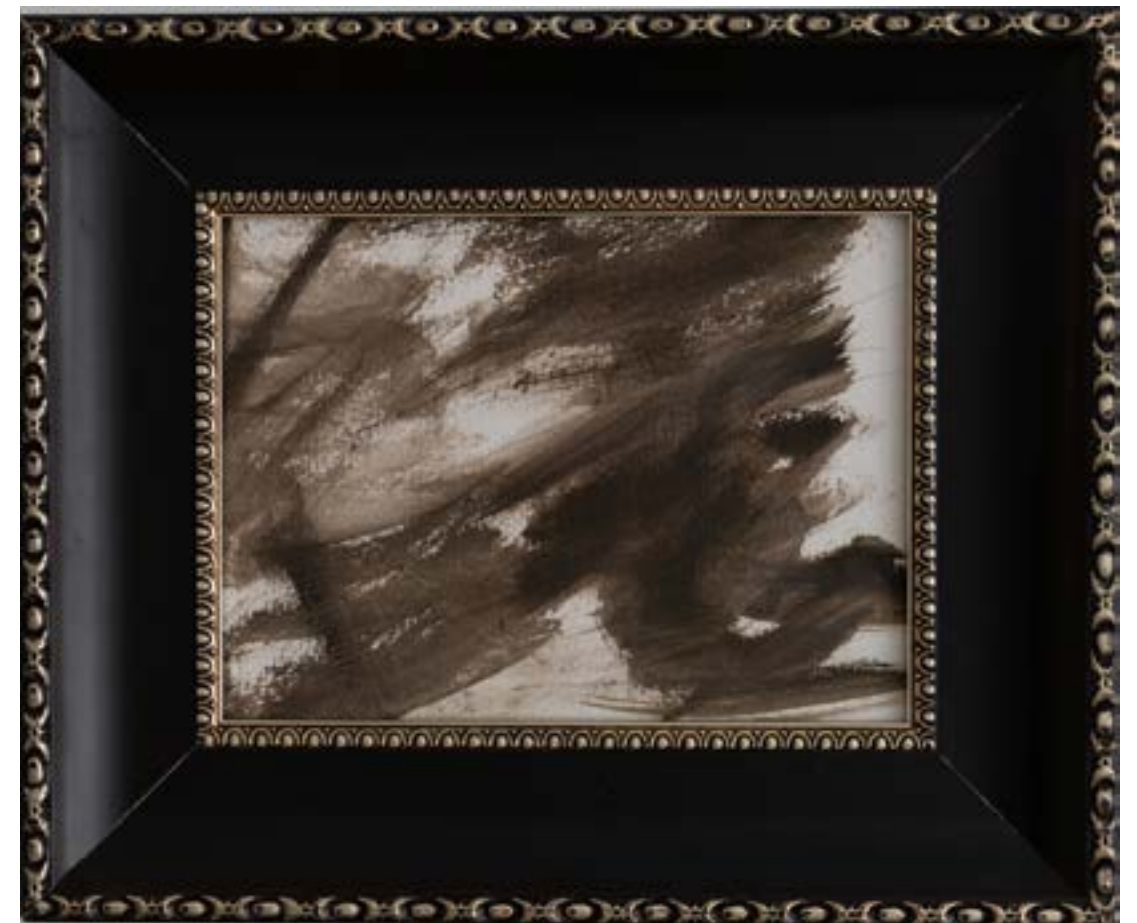
SABACHTHANI | mi hai abbandonato?, 2019, olio su carta, cm 23x17