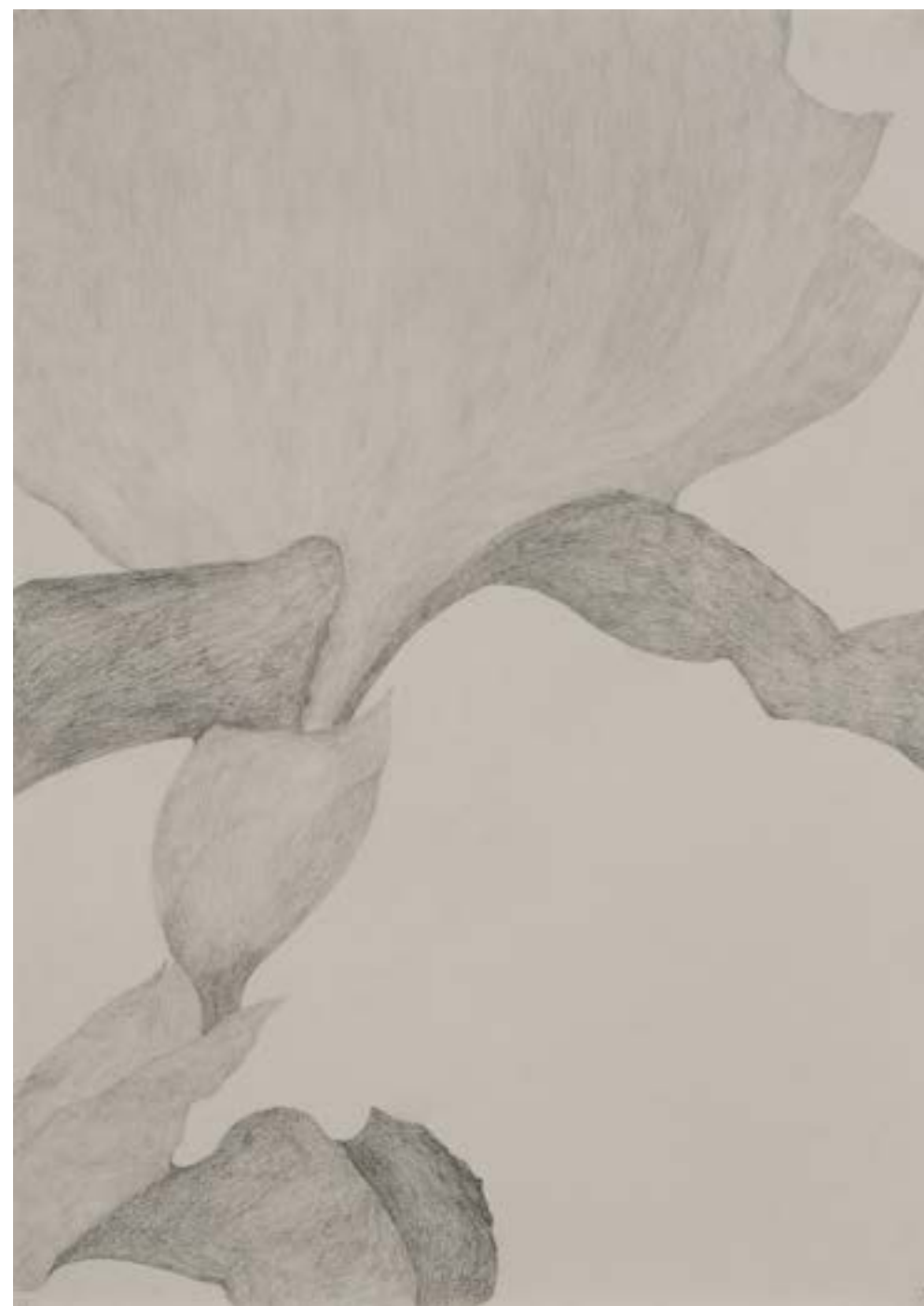
EGKRATEA | frutto della Temperanza 6/12, 2020, matita su carta grigia, cm 70x50