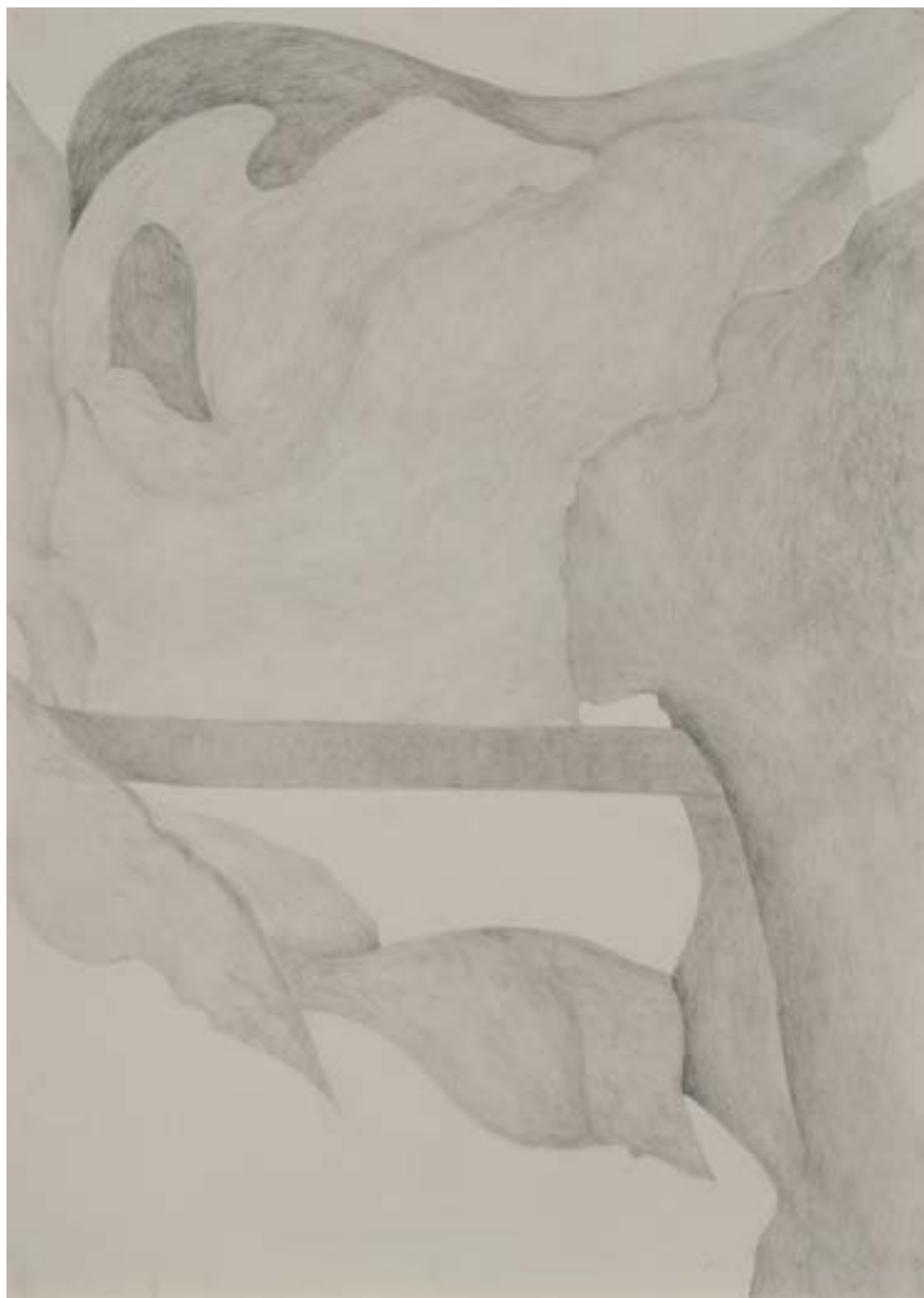
EGKRATEA | frutto della Temperanza 5/12, 2020, matita su carta grigia, cm 70x50