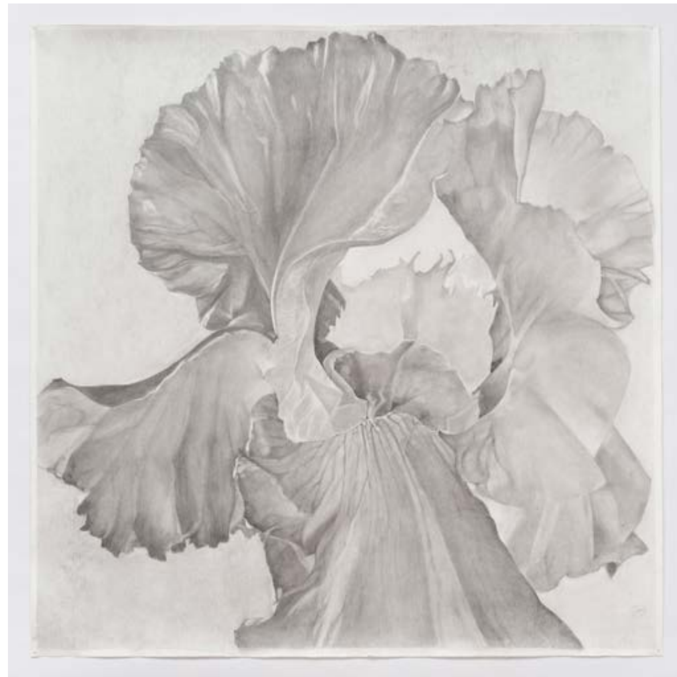
Autoritratto, 2021-2022, matita su carta, cm 103x103