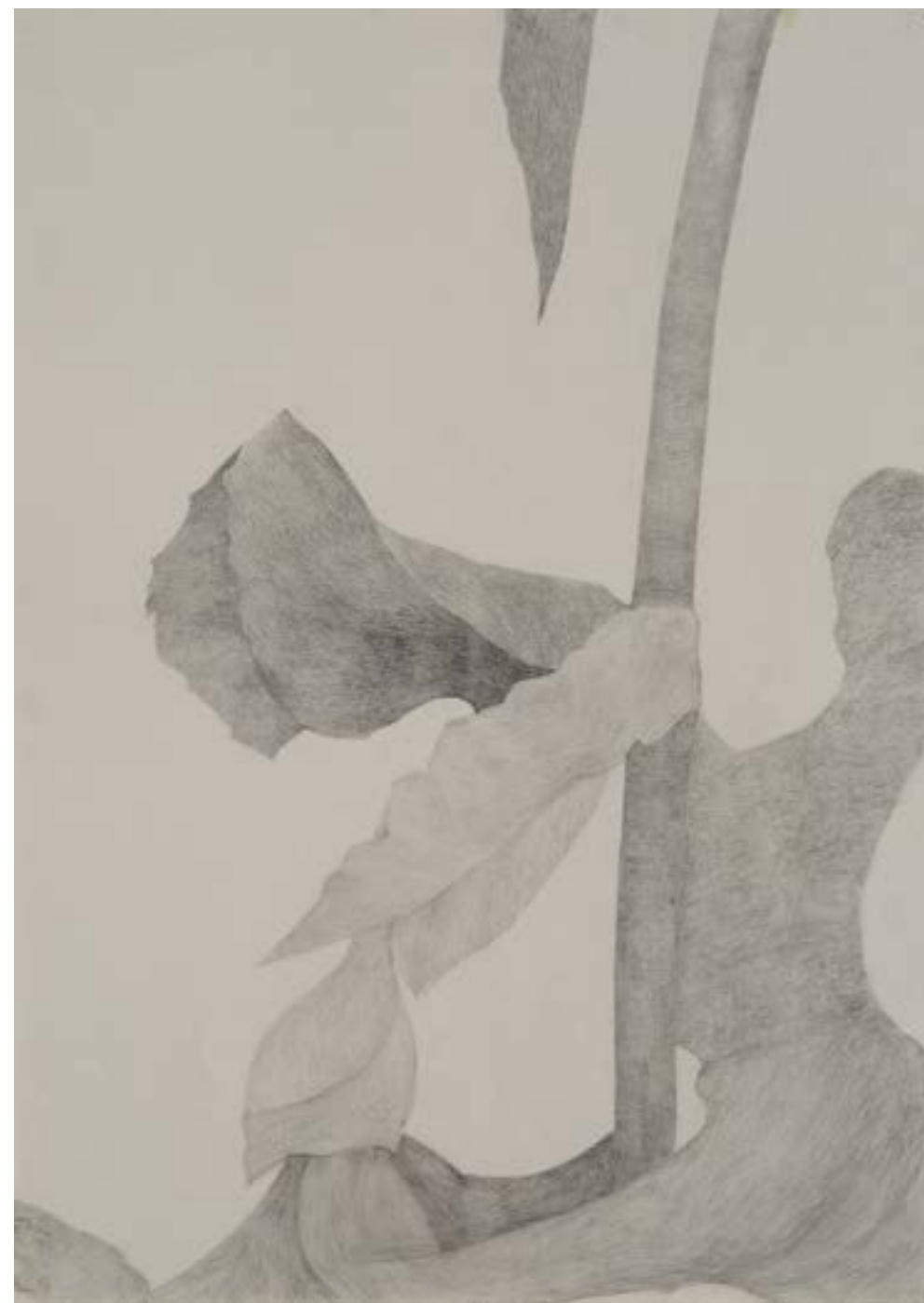
EGKRATEA | frutto della Temperanza 4/12, 2020, matita su carta grigia, cm 70x50