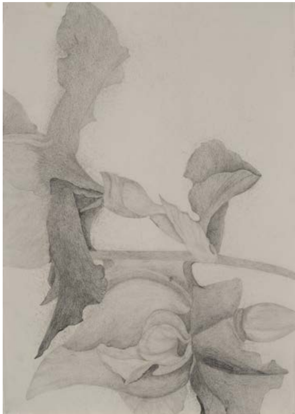
EGKRATEA | frutto della Temperanza 7/12, 2020, matita su carta grigia, cm 70x50