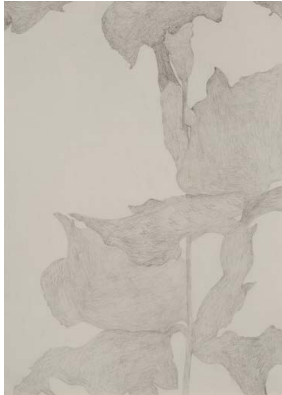
EGKRATEA | frutto della Temperanza 8/12, 2020, matita su carta grigia, cm 70x50