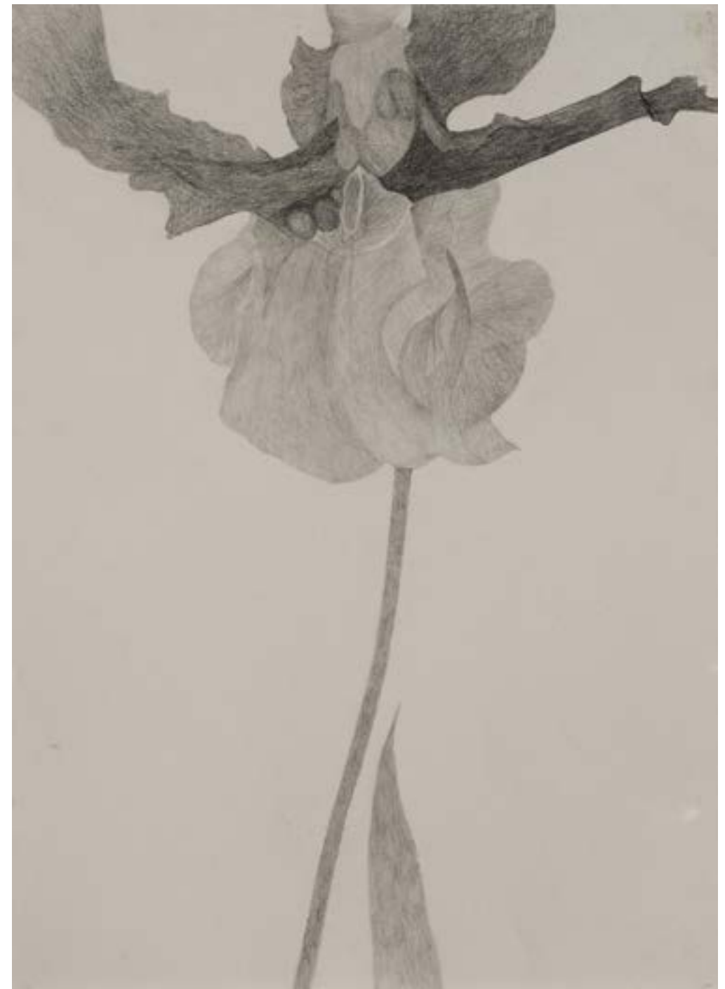
EGKRATEA | frutto della Temperanza 10/12, 2020, matita su carta grigia, cm 70x50