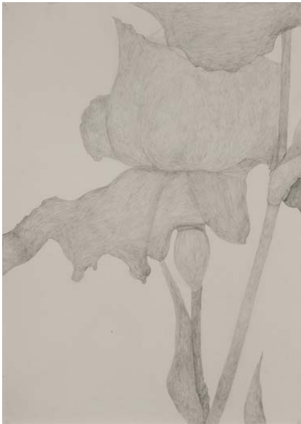
EGKRATEA | frutto della Temperanza 11/12, 2020, matita su carta grigia, cm 70x50