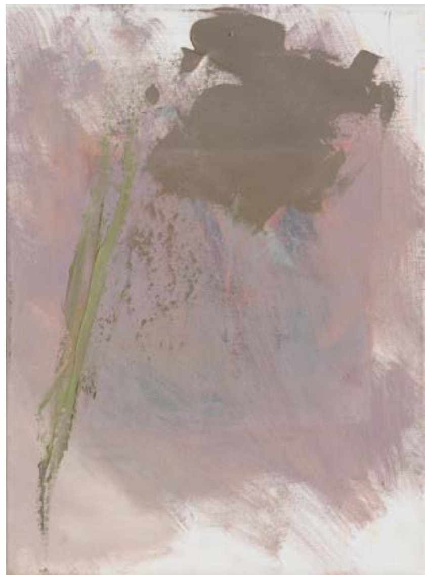
NISSI | sarà la nostra guida, 2020, olio su tela, cm 23x39