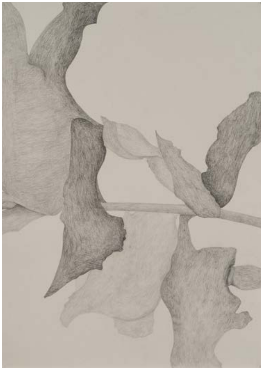
EGKRATEA | frutto della Temperanza 9/12, 2020, matita su carta grigia, cm 70x50