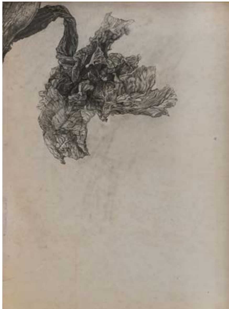
MONOGENE | Unico e Incomparabile, 2024, matita su carta antica, cm 17x23