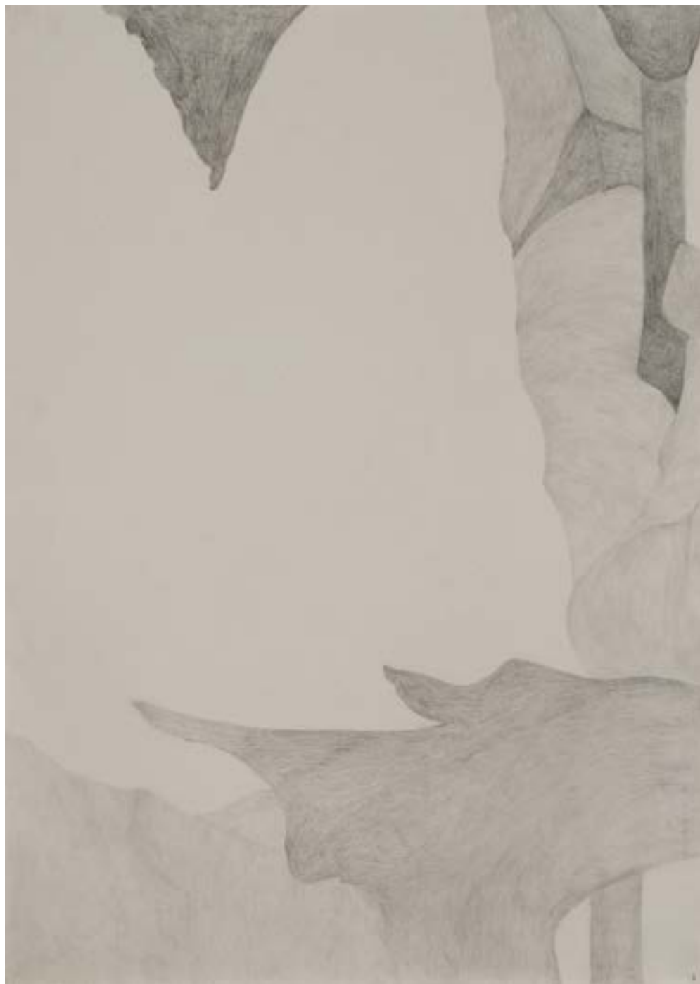
EGKRATEA | frutto della Temperanza 3/12, 2020, matita su carta grigia, cm 70x50