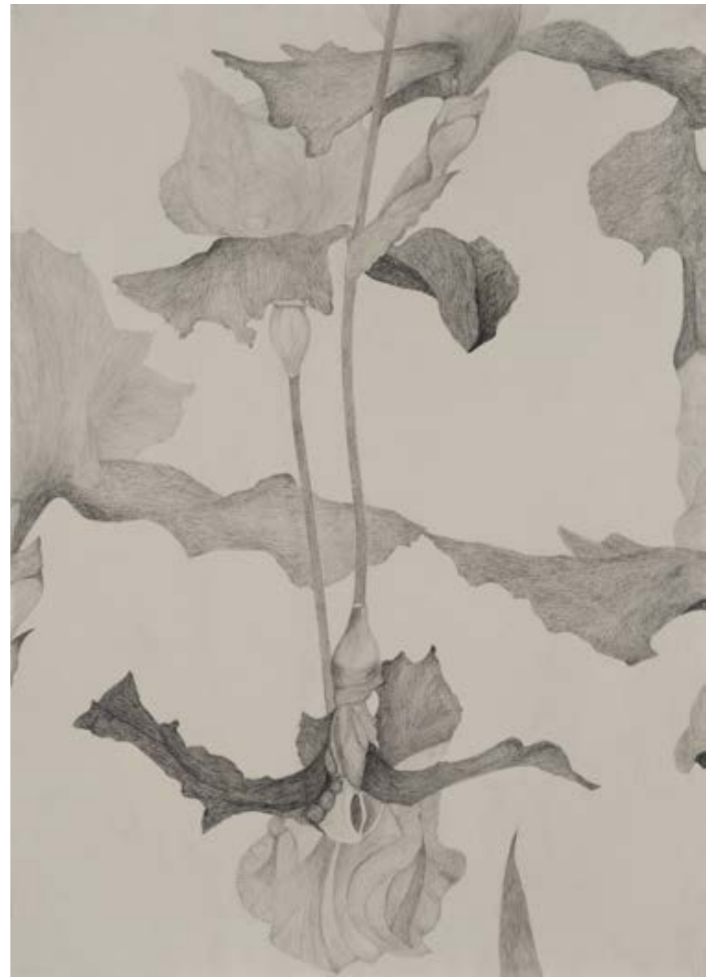
EGKRATEA | frutto della Temperanza 12/12, 2020, matita su carta grigia, cm 70x50